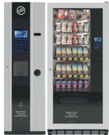
Fas Mia + Fas 750 Business